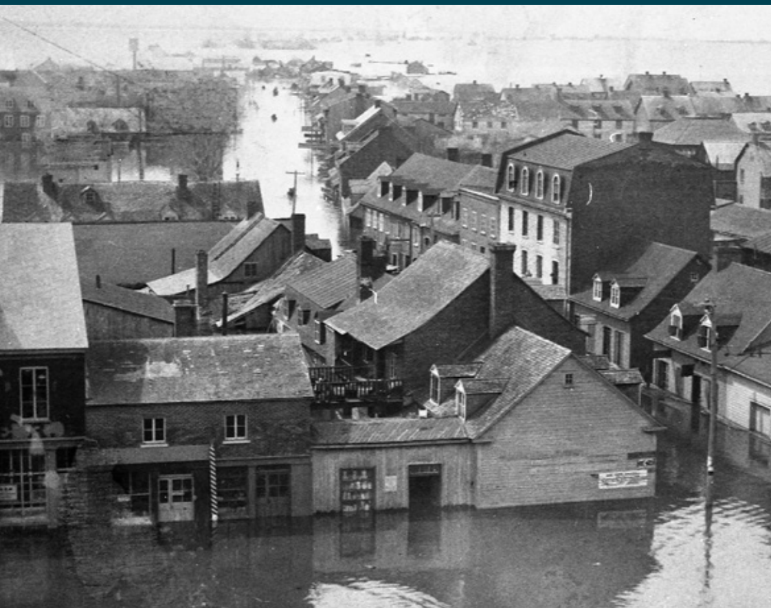
Vue générale de l'inondation de la ville de Trois-Rivières lors de l'inondation de 1896.