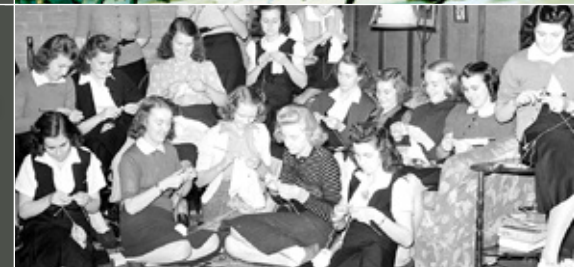
De haut en bas : Soudeur à l'ouvrage dans une usine de guerre à Québec, 1943. H. Paul. BANQ (QC), E6,S7,SS1,P23724 ; Vue arrière de l'église de Saint-Eustache et de la fuite des Patriotes. N. Hartnell / E.-G. Starr, 1840 (original créé le 14 décembre 1837). BANQ (MTR), P318,S4,P7 ; Groupe d'étudiantes de la Montreal West High School tricotant au profit des œuvres de la Croix-Rouge, 1939 © BANQ (MTR), P48,S1,P4046.