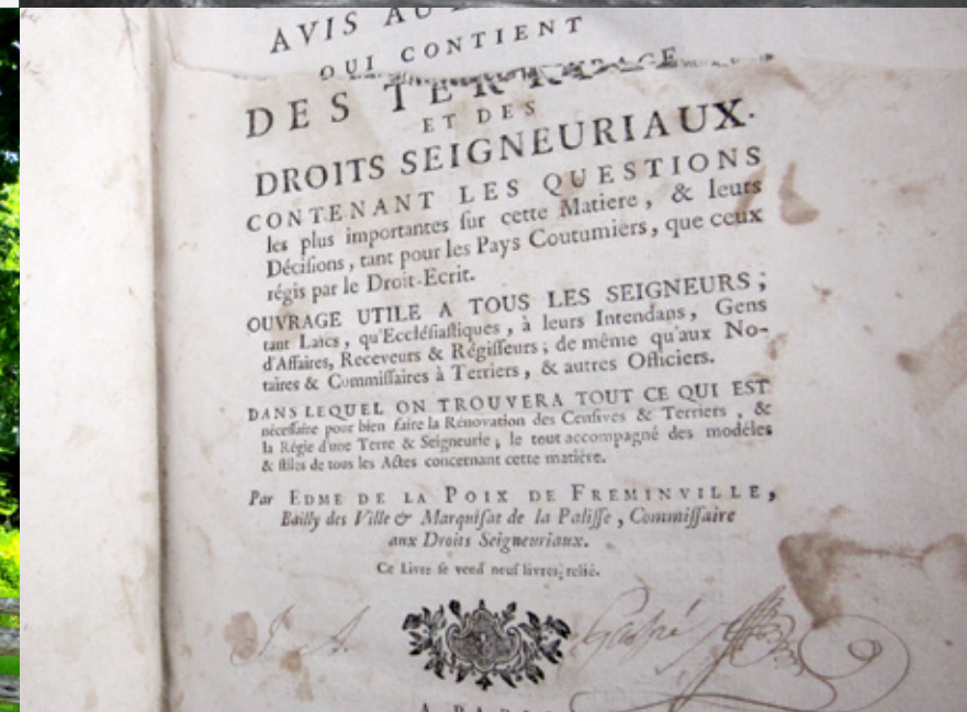
Exemplaire de La pratique universelle pour la rénovation des terriers et des droits seigneuriaux d'Edme de La Poix de Fréminville portant l'ex-libris d'Ignace Aubert de Gaspé. Photo : Isabelle Robitaille. BANQ-QC, RES/BC/103.