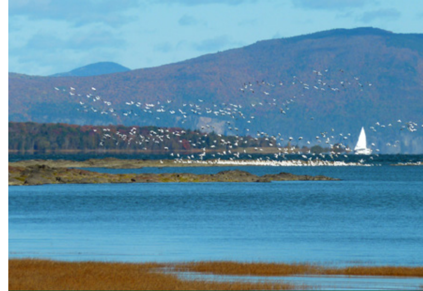
Vue sur le fleuve depuis la Pointe-de-St-Vallier. Photo : Yves Guillet, 2012.