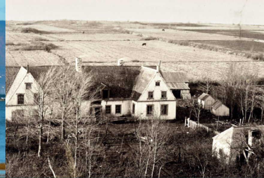
Manoir de Gaspé à Saint-Jean-Port-Joli vers 1890. Photo : E. Mercier. BANQ-QC, P600.S6.D5.P1019.