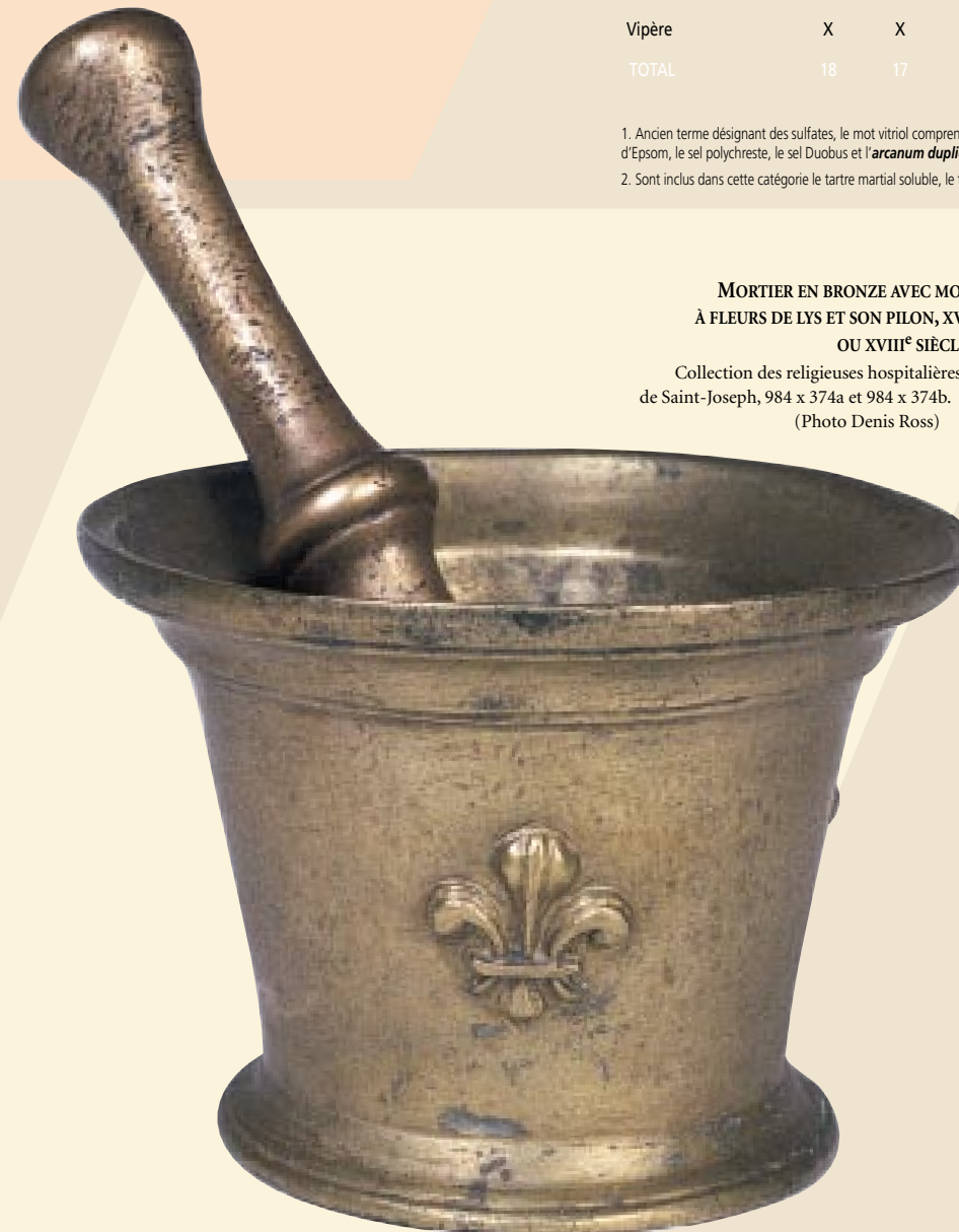
MORTIER EN BRONZE AVEC MOTIFS À FLEURS DE LYS ET SON PILON, XVII e OU XVIII e SIÈCLE. Collection des religieuses hospitalières de Saint-Joseph, 984 x 374a et 984 x 374b.