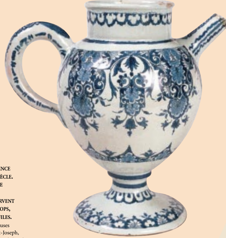
CHEVRETTE EN FAÏENCE DE ROUEN, XVIII e SIÈCLE. POTS DE PHARMACIE PAR EXCELLENCE, LES CHEVRETTES SERVENT À CONTENIR LES SIROPS, LES MIELS ET LES HUILES. Collection des religieuses hospitalières de Saint-Joseph, 984 x 304.1.

Néanmoins, les apports canadiens à la pharmacopée européenne restent peu nombreux et les praticiens de la santé établis au Canada ont surtout recours aux médicaments importés. L'apport amérindien à la médecine officielle, quoique difficile à évaluer, semble modeste et circonstanciel. Il en va autrement, toutefois, de la médecine populaire qui utilise plus facilement les plantes et les produits disponibles dans l'entourage immédiat des personnes. Les plantes utilisées par les Amérindiens