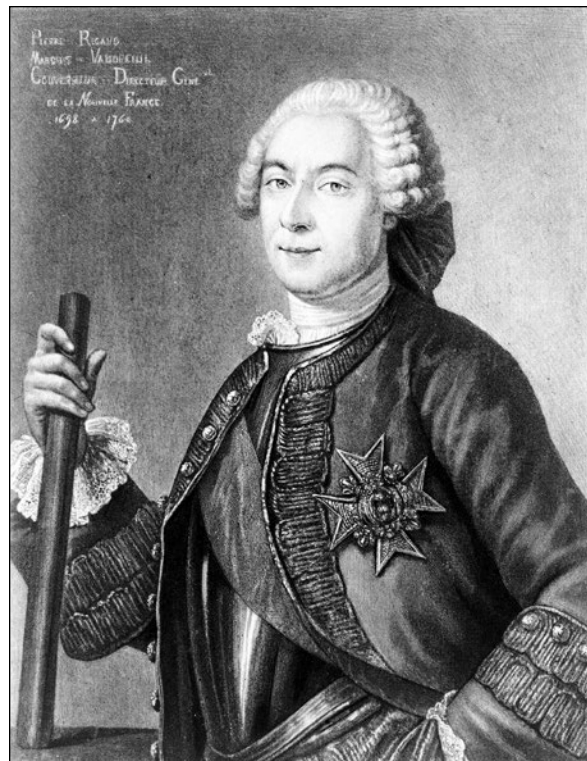
Pierre de Rigaud, marquis de Vaudreuil vers 1897.

Les nobles qui s'installent au Canada sont pour la plupart issus des rangs inférieurs de la noblesse française 10 . Pour être considéré comme un véritable noble en Nouvelle-France, il faut répondre à certaines caractéristiques distinctives : « être qualifié d'écuyer dans les actes – donc être perçu et accepté en tant que noble par son milieu –, vivre noblement – c'est-à-dire ne pas déroger en exerçant un travail manuel – et servir le roi 11 ». La surveillance royale y est moins sévère, notamment parce qu'il n'y a pas d'impôts à payer, donc « aucun avantage financier à contrôler de cette façon la noblesse 12 ». La majorité des nobles le sont de naissance, par la patrilinéarité, et quelques-uns le sont par anoblissement. Pourtant, certains roturiers, sans ascendance nobiliaire, réussissent à se faire reconnaître comme tels. Plusieurs stratagèmes sont mis en pratique, tels que la modification de l'homonymie de la famille ou la prise du titre d'écuyer dans les registres paroissiaux et les actes notariés 13 . Ainsi, la noblesse canadienne est un groupe fortement hiérarchisé 14 . Lorraine Gadoury y décèle cinq sous-